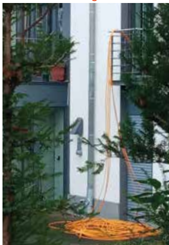
Verlegung von Kabeln für die digitalen Verbindungen wie W-LAN