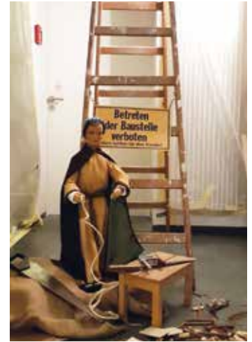
Krippenfigur des Heiligen Josef als Hinweis auf die Baustelle