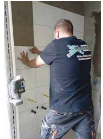
Fliesenleger in Aktion