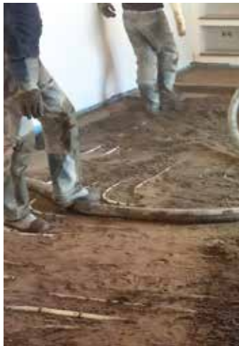
Im Esszimmer wurde der Estrich neu verlegt.